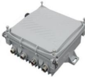
نمونه ای از اکسس پوینت خارجی