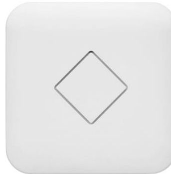
نمونه ای از اکسس پوینت داخلی