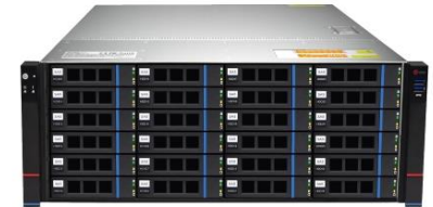
نمونه ای از سرورها